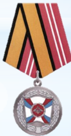
Медаль "За укрепление боевого содружества"