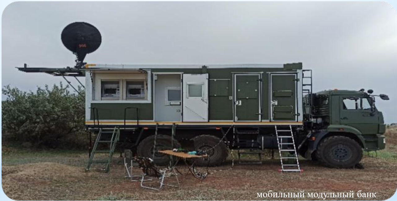
мобильный модульный банк