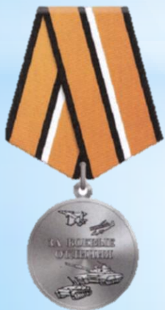
Медаль "За боевые отличия"