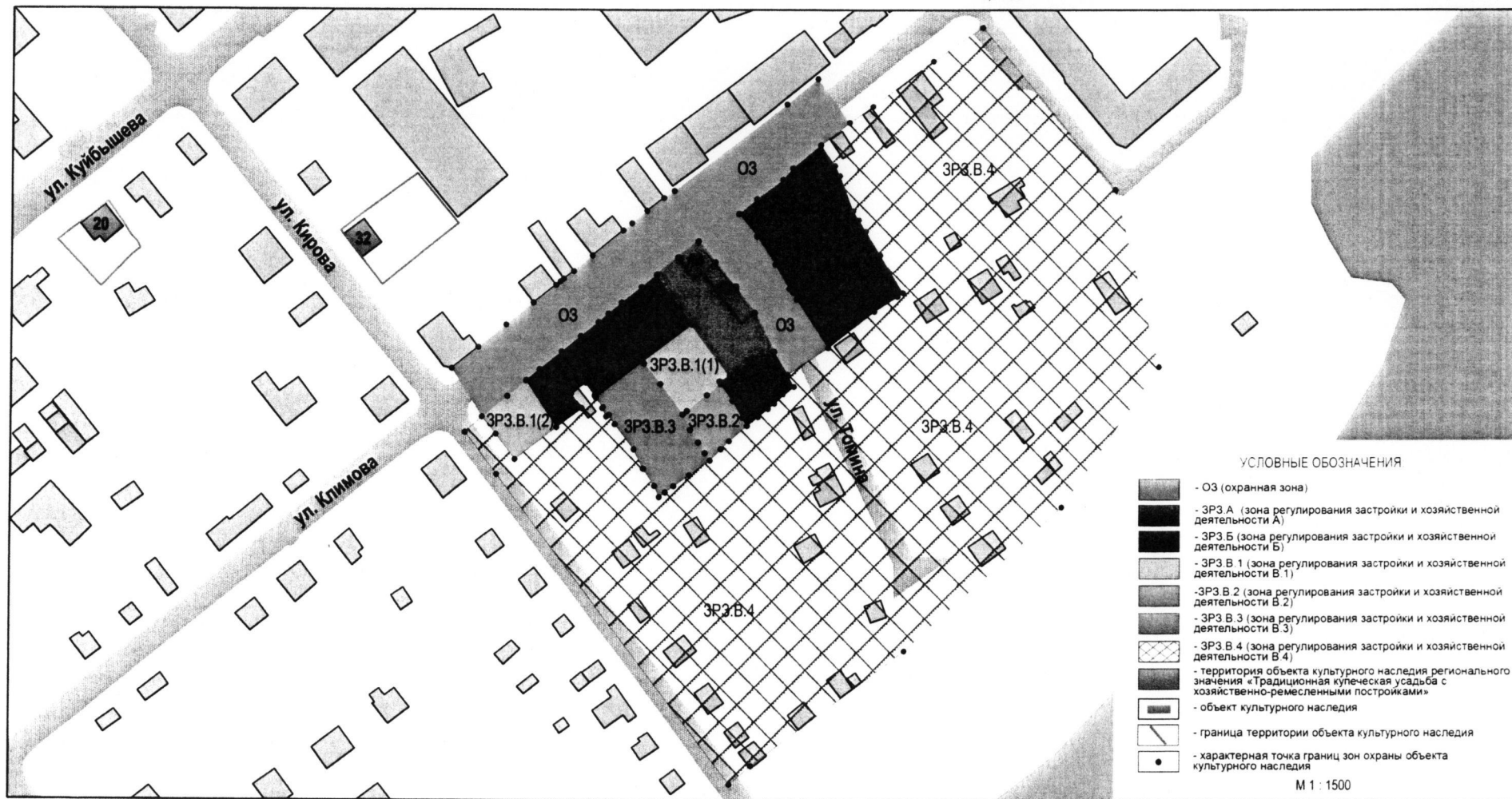
Рисунок 1. Карта границ зон охраны, режимов использования земель и градостроительных регламентов в границах зон охраны объекта культурного наследия регионального значения «Традиционная купеческая усадьба с хозяйственно-ремесленными постройками», находящегося по адресу: Курганская область: г. Курган, ул. Климова, 40, 40а. М 1 : 1500.

Приложение к границам зон охраны, режимам использования земель и градостроительным регламентам в границах зон охраны объекта культурного наследия регионального значения «Традиционная купеческая усадьба с хозяйственно-ремесленными постройками», находящегося по адресу: Курганская область: г. Курган, ул. Климова, 40, 40а